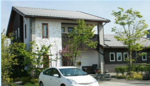
住宅展示場『住宅館』